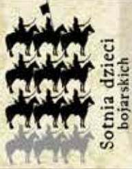
Sotnia dzieci bojarskich