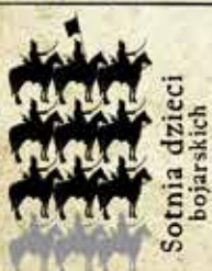
Sotnia dzieci bojarskich