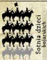
Sotnia dzieci bojarskich