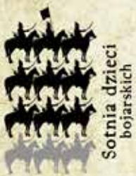
Sotnia dzieci bojarskich