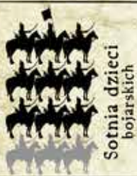
Sotnia dzieci bojarskich