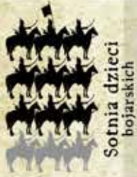
Sotnia dzieci bojarskich