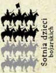
Sotnia dzieci bojarskich