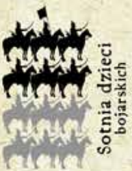
Sotnia dzieci bojarskich