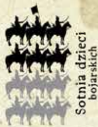
Sotnia dzieci bojarskich