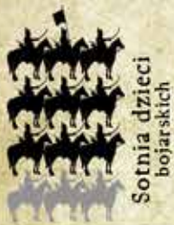
Sotnia dzieci bojarskich